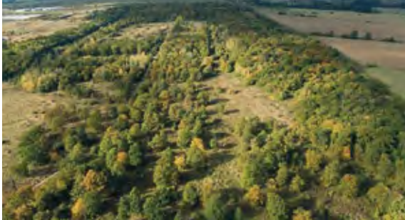
Der erste Wildkatzenkorridor verbindet seit 2007 den Nationalpark Hainich mit dem Thüringer Wald.

Niedersachsen, Baden-Württemberg, Thüringen und Nordrhein-Westfalen werden Korridore für die Wildkatze gepflanzt oder die Wildkatzenlebensräume aufgewertet und verbessert. In Sachsen soll eine Korridorplanung erstellt werden. In diesen Bundesländern sowie in Bayern, im Saarland und in Sachsen-Anhalt sammeln Hunderte von Freiwilligen Haarproben an Lockstöcken, die anschließend im Labor des Senckenberg-Instituts in Frankfurt genetisch untersucht werden. „Damit haben wir erstmals sozusagen eine bundesweite Wildkatzeninventur“, freut sich Mölich. „Wir konnten nachweisen, dass die Wildkatzen die neu gepflanzten Korridore nutzen und es auch im Kottenforst bei Bonn und im Odenwald inzwischen Wildkatzen gibt.“