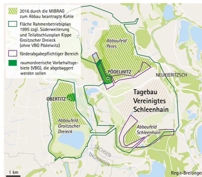
Hier liegen 270 Mio. Tonnen Kohle und die MIBRAG hat deren Abbaggerung beantragt: Ohne die Orte Pödelwitz und Obertitz immerhin noch 235 Mio. Tonnen Kohle, ohne Teilfeld „Groitzscher Dreieck“ (links) und ohne Pödelwitz wären es noch 182 Mio. Tonnen.

Die Summen, die bislang als umweltschädliche Subventionen für die Braunkohle nicht erhoben werden, würden dazu beitragen, dem Vorhaben aufgrund geänderter wirtschaftlicher Rahmenbedingungen wahrscheinlich endgültig den Garaus machen.