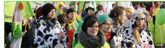
Kontakt/Geworben durch BUND-Gruppe:

Dann sprechen Sie uns an – unsere Kontaktdaten finden Sie umseitig.